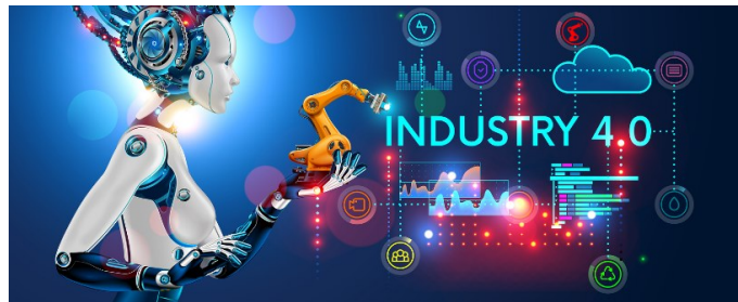
Figure 1: Cuarta revolución industrial

Un Sistema de Gestión de Base de Datos , es una máquina cuya función principal es almacenar y manipular datos, para poder acceder a ellos sin problema alguno; su objetivo principal es el almacenamiento y la recuperación de la información de forma práctica y eficiente, por medio de Bases de Datos , las cuales permiten la colección de los datos por medio de repositorios, que serán contenidos en un lago de datos , que permite almacenar grandes conjuntos y diversos datos sin procesar en su formato original, y que mantiene una perspectiva general de éstos. Actualmente, estamos comenzando a ver llegar la cuarta transformación industrial (ver figura 1) con el desarrollo e implementación de tecnologías desde la inteligencia artificial y el internet de las cosas, hasta la robótica y biotecnología, convirtiendo a los sistemas robustos industriales en máquinas inteligentes basadas en la automatización y análisis de datos, contruidos sobre la infraestructura de la revolución digital.